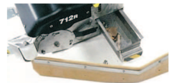
Kehr-Walzenschrubbaggat mit Grobschmutzsammelbehälter